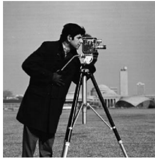
Gambar 1. Kameramen sedang mengambil gambar action

Gambar harus jelas, terbaca serta tidak kabur/blur. Gambar 2 (a) adalah contoh gambar yang jelas, sedangkan Gambar 2 (b) contoh gambar yang kabur. Hindari pemakaian gambar seperti pada Gambar 2 (b)